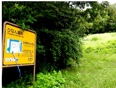
▲日本野鳥の会WING跡地

にあります。避難場所としてもふさわしくなく、地震災害ではかえって危険だと思いました。(南平2丁目 Y)