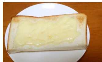
写真はやみつきトースト クックパッドから

《2016年 5月の無料法律相談》 市役所6階 共産党控室 午後1時～3時 5月 12日(木) ※予約が必要ですので、お申し込み下さい。